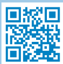
Structure de l'école obligatoire vaudoise